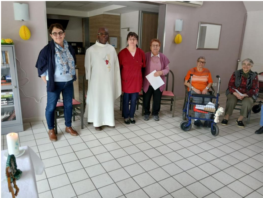
Messe à la MARPA ce vendredi 5 avril. Un temps toujours très attendu et réclamé dans chacune des EHPAD où nous allons !